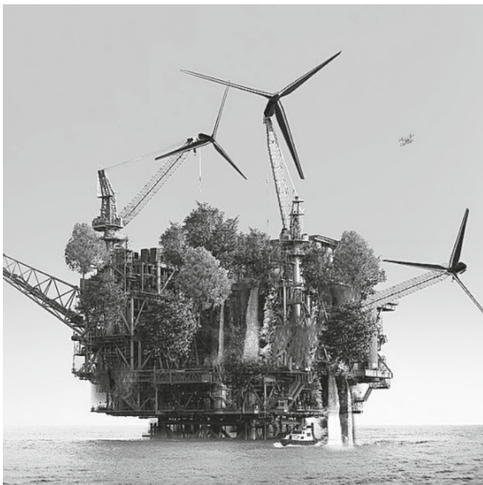
Abb.: XTU architectes, X_Land, Rendering, 2020

Vom 23.03.2024 – 01.09.2024 ist dort die Sonderausstellung "Transform! Design und die Zukunft der Energie" zu sehen. Die Ausstellung widmet sich der radikalen Transformation des Energiesektors aus der Designperspektive: vom Alltagsprodukt für die Nutzung erneuerbarer Energien bis zur Gestaltung von Solarhäusern und Windkraftanlagen, vom intelligenten Mobilitätskonzept bis zur Zukunftsvision energieautarker Städte.